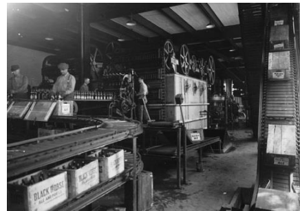
Chaîne de production, brasserie Dawes, Lachine, QC, vers 1920

PROGRAMMATION SPÉCIALE EN LIEN AVEC L'EXPOSITION Le 23 septembre prochain, Les Belles Soirées de l'Université de Montréal sont de retour au Musée avec une conférence de l'historien Laurent Busseau sur la guerre des Bootleggers au Québec durant la prohibition américaine (1920-1933) . Avec la prohibition américaine, le « Bootlegging » s'est développé au Québec comme une véritable organisation criminelle autour du trafic d'alcool vers les États-Unis.