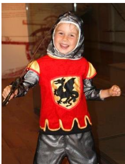
Enfant costumé en chevalier

se feront assigner un rôle et apprendront une suite de mouvements avec les règles de sécurité. Une fois l'échauffement terminé, une courte scène de combat sera filmée comme au cinéma !